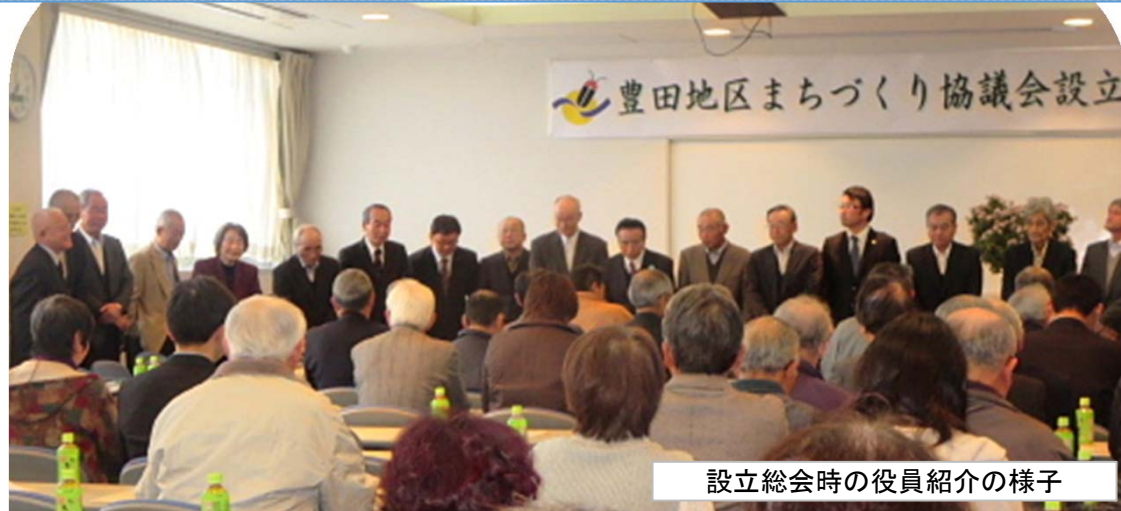
設立総会時の役員紹介の様子