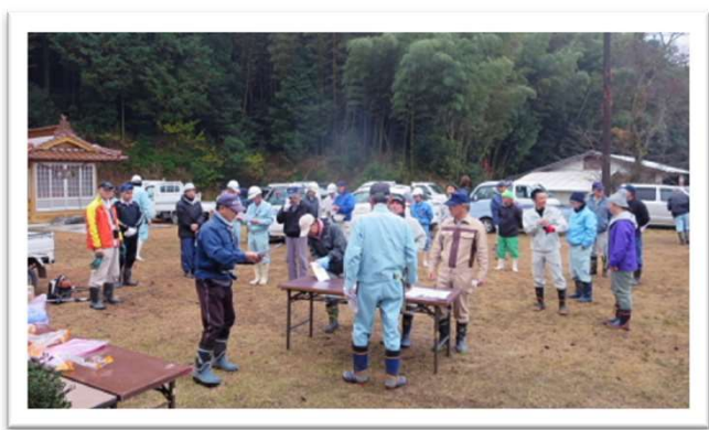
作業前のみなさん

そして作業終了後は、食推の皆さんが作ってくださった温かいしし汁とおむすびをいただきました。とても美味しく、心も体も温まりました。ありがとうございました。