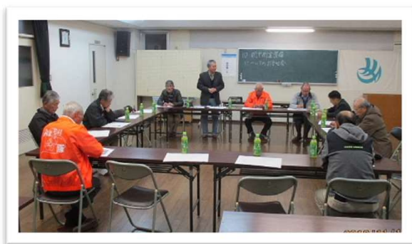
肥中街道整備打合せの様子