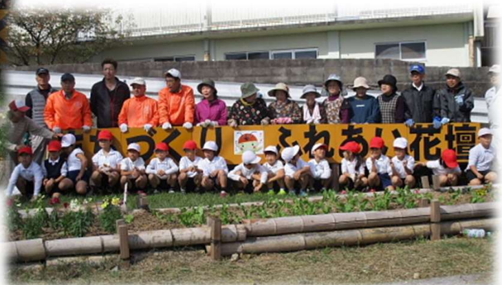
出来上がった花壇の前で