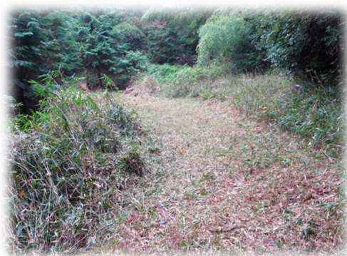
作業後のきれいになった街道