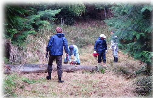
大木をチェーンソーで切っています