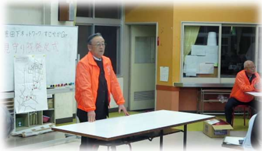
豊田下ネットワーク長