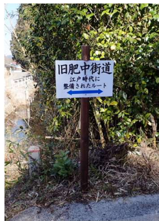
このような案内標識が要所要所に設置されました。