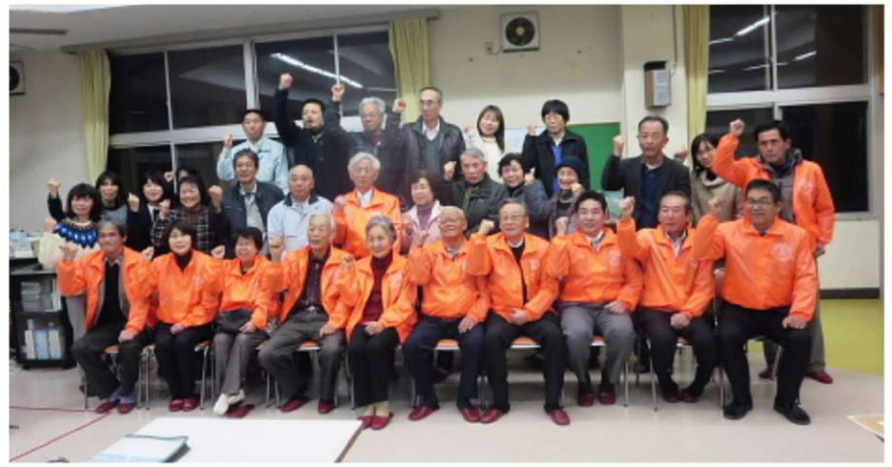
豊田下見守り隊です！ よろしくお願ひします。