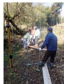
白土ルート改修 作業中の様子と 作業完成後です