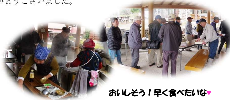
おいそう！早く食べたいな♡