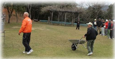
ん？ 一輪車 何賞？