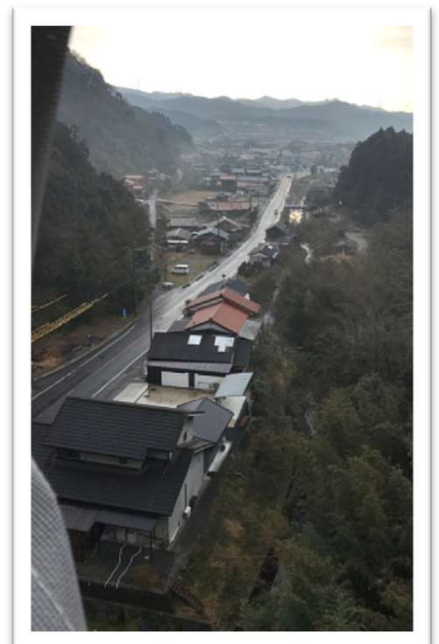
橋の上から総合支所方面をパチリ